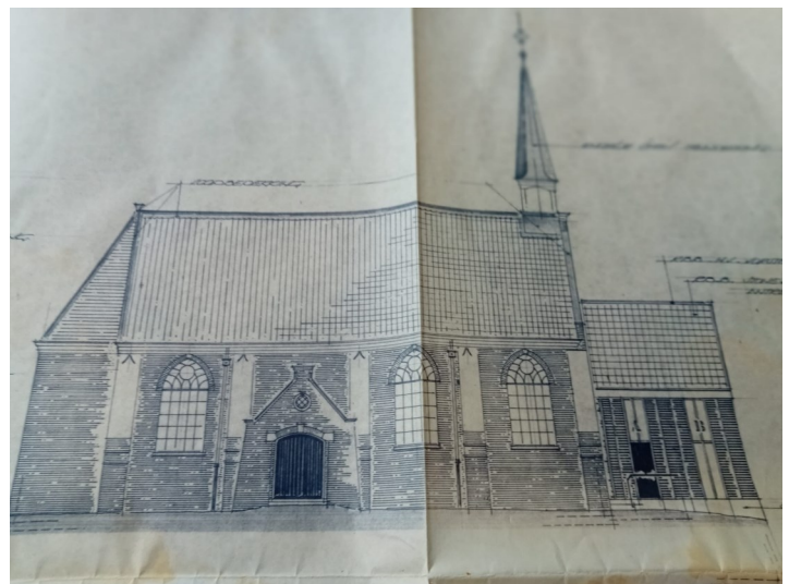
Tekening hoe de kerk er na de restauratie ging uitzien